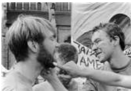
Vill du också göra något? Se tips på sista sidan.