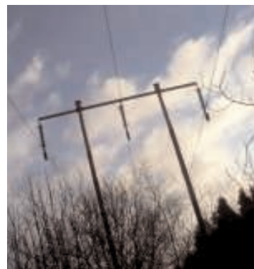
De verkliga vinnarna efter avregleringarna är elleverantörerna, enligt en studie.