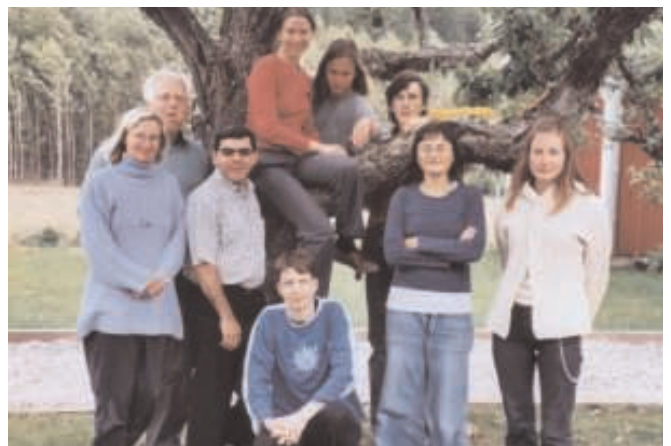
MJVs styrelse år 2004.

ARBETSGRUPPEN MOT PRIVATISERING MILJÖFÖRBUNDET JORDENS VÄNNER