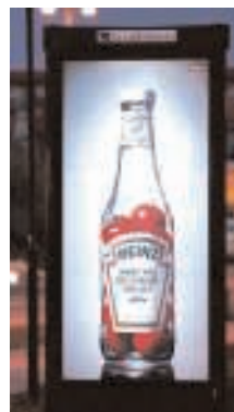
Clear Channel syns.

Men också hur det påverkar sådant som det kulturella utbudet, skolornas inriktning, nöjernas, krogarnas och caféernas