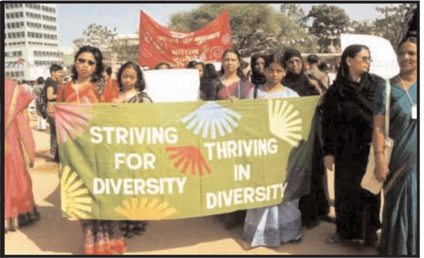
BILDER: VASUDHAIVA KUTUMBAKAM

GEMENSAM STYRKA. Under Asia Social Forum 2003 samlades tiotusentals människor för att diskutera social rättvisa, miljö och internationell solidaritet.